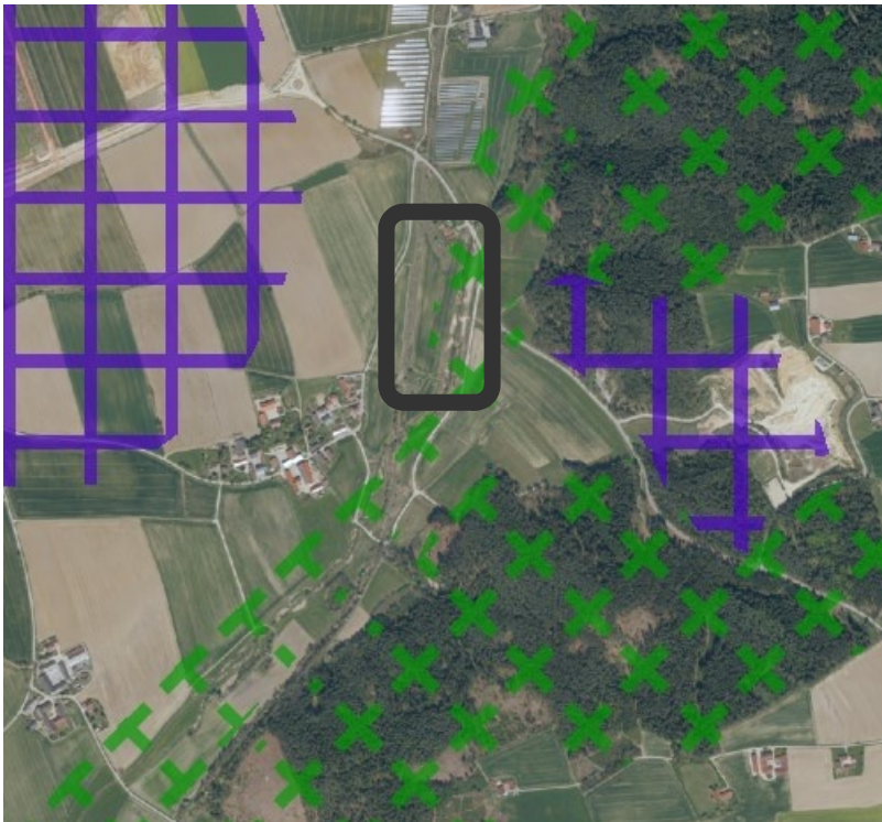
Abbildung 1: Ausschnitt aus dem Regionalplan Region Landshut. Grüne Kreuzschraffur bedeutet Landschaftliches Vorbehaltsgebiet.

Die vorhabensbedingten Auswirkungen auf die Schutzzwecke des landschaftlichen Vorbehaltsgebietes stellen sich wie folgt dar: