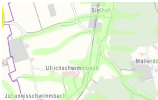
Abbildung 3: Wassersensible Bereiche in der Umgebung des Vorhabens.

Im Geltungsbereich ist zumindest zeitweise mit hohen Grundwasserständen zu rechnen.