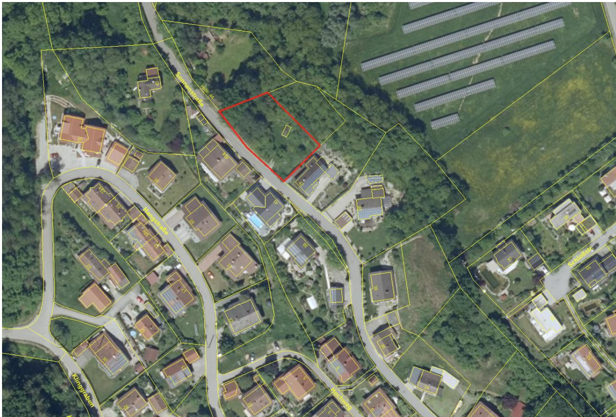
Abbildung 2 Geplanter Geltungsbereich der Einbeziehungssatzung „Warth - Sonnenstraße“

Das Grundstück ist bis auf eine etwa zentral gelegene alte Fertiggarage noch komplett unbebaut.